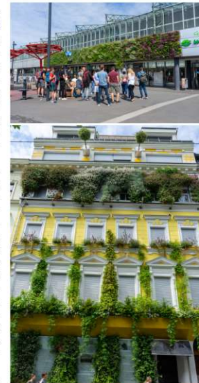
Oben eine Grünfassade am Bahnhof Spittelau, unten ein Bürgerhaus in der Hannovergasse mit verschiedenen Begrünungen.

Den Rest des Vormittages bestritten wir mit unserem Busfahrer Till, der uns mit den Objektadressen im Navi noch an ein Hotel mit exzellenter In-