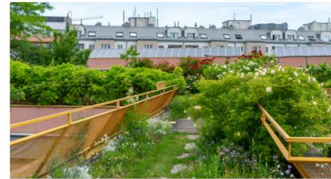
Eine intensive Dachbegrünung wie hier auf dem Dach der Sargfabrik, zieht viel Pflege und Aufmerksamkeit nach sich.

ren die Parkpflege und die Berufsausbildung in Österreich. Während bis vor einigen Jahren die Stadt Wien in Hirschstetten alle Blumen und Pflanzen in den eigenen Gewächshäusern anzog, wird heute das meiste zugekauft. Die Produktionshäuser werden aktuell für Events vermietet oder ab-