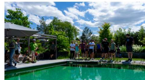
Schwimmteiche, das Markenzeichen der Firma Kittenberger, sind im Gartenpark in vielen Varianten zu bestaunen.

Tag 2 führte uns zunächst auf die andere Donauseite. Dort liegen die