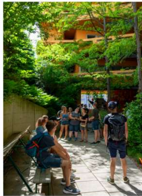
Oben links der Innenhof der Sargfabrik, eine gemeinnützige Wohnanlage. Unten die Kombiklasse auf dem Dach von Ikea-Wien- Westbahnhof.

mussten. Spezielle Kräne hieften die Pflanzgefäße um 3 Uhr morgens, denn nur da werden keine Straßenbahnen behindert, in die vorgestellte Fassade und auf das Dach des Möbelhauses. Wie lange es die „skandinavischen Baumarten“ wie Birke und Buche, die nach den Vorgaben des Möbelgiganten dort stehen sollen, ohne Schaden aushalten werden, wird erst in den kommenden Jahren zu beurteilen sein. Hitze, Wind und trockene Luft sind trotz bester Bewässerung sicher nicht sehr zuträglich für das Wachstum. Ihre Wirkung hat die Pflanzung im Loungegarten auf dem Dach des Ikea trotzdem nicht verfehlt. Der Tag ließ sich dort mit Blick auf Wien und einem Kaltgetränk perfekt ausklingen.