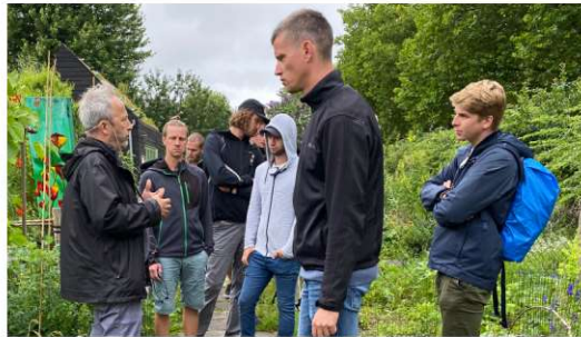
Im Dak Park, ein Park auf dem Dach eines Einkaufszentrums. Die Pflege erfolgt durch eine Aktionsgruppe ehrenamtlich.

tel und im Park zur Verfügung, zum anderen kann durch die intelligente Steuerung der Wasserstand gesteuert werden, sodass Starkregenereignisse abgepuffert werden. Den Investoren war merklich die Begrünung ein sehr wichtiger Aspekt, sodass die Bäume in den Innenhöfen extra Wurzelraum erhalten haben, indem die Baumgrube durch die Tiefgarage durchgeführt wurden und dadurch sogar Abstriche bei der Anzahl der Tiefgaragen-Stellplätze in Kauf genommen wurden. Auch dieses Projekt zeigt wieder, dass die Begrünung zentraler Bestandteil der zukünftigen Stadtentwicklung