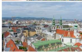
Oben der Innenhof des Boutiquehotels, rechts die Grünfassade am Haus des Meeres und in der Mitte der Blick über Wien vom Dach des Haus des Meeres.

nenraumbegrünung und an das Haus des Meeres fuhr. Am Haus des Meeres, das beeindruckte durch seine riesige Fassadenbegrünung, nutzen die meisten die Zeit, um auf eigene Faust mit dem Lift aufs Dach zu fahren. Der Ausblick war noch einen Tick spektakulärer als auf dem IKEA und im Gegensatz zu einer Rundfahrt auf dem