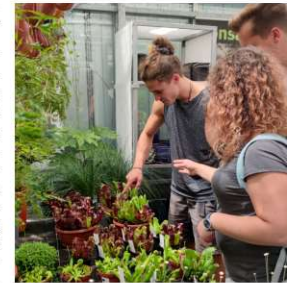
Fleischfressende Pflanzen, hier in Szene gesetzt, waren nur eines der Highlights im Gartencenters Zaubergarten in Wertheim.