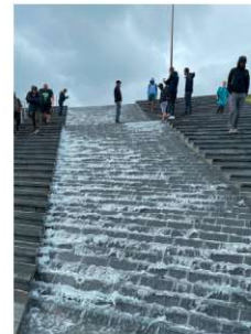
Im Dak Park gibt es auch eine spektakuläre Wasserfalltreppe, die durch ihr Rauschen den Verkehrslärm ausblenden soll.