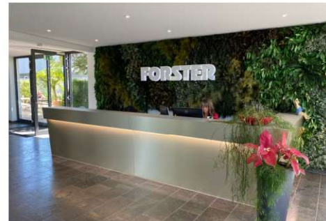
Im Foyer von Galabau Forster, einer der erfolgreichsten Landschaftsbaufirmen in Nordrhein-Westfalen.

Nach einem anschließenden Rundgang über das Firmengelände wurden wir noch mit einem großzügigen Mittagessen vom Grill durch die Firma Forster versorgt, sodass wir für die Heimfahrt gestärkt waren. Jan-Philipp Wassermann