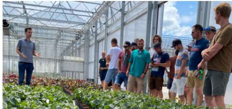
Studierende in einer Baumschule in Boskoop, eine der ältesten und größten Baumschulregionen in Holland.

Hier besuchten wir zunächst die Baumschule Esveld, welche eine wunderschön eingewachsenes Freilandgartencenter darstellt. Besonderheiten sind das Markenzeichen der Firma. So findet man hier beispielsweise über 60 verschiedene Ahorn-