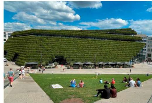
Der Kö-Bogen II, ein Leuchtturmprojekt der Gebäudegrünung in Düsseldorf. Fassade und Dach wurden mit 30.000 Hainbuchen bepflanzt.

grüne Gebäudehülle kühlt das Einkaufszentrum im Sommer um bis zu zehn Grad, sodass langfristig weniger Energie für die Kühlung aufgewendet werden muss.