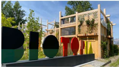
Deutscher Pavillon auf der Floriade, die größten Gartenausstellung in Europa. Sie findet nur alle zehn Jahre statt.

Nach einer weiteren Besichtigung der nebenan gelegenen Exportbaumschule Joh. Stolwijk fahren wir schon wieder weiter nach Rotterdam. Hier standen zunächst der Checkin im Hotel und anschließend eine Stadtführung durch Rotterdam mit dem Fahrrad an.