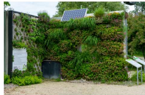
Begrünte Fassaden, Regenwassernutzung und Photovoltaik sind echte Zukunftsthemen im Gartenbau. Die Kombiklasse an der Fachschule Gartenbau erkundete auf ihrer Österreich-Exkursion zahlreiche beispielgebende Projekte in Wien. Das Foto, das einen Ausstellungsbeitrag auf der Garten Tulln darstellt, zeigt Möglichkeiten einer Fassadenbegrünung im städtischen Raum.

Sparkasse Landshut IBAN: DE 87 7435 0000 0000 0037 94 BIC: BY LAD EM1 LAH VR Bank Landshut IBAN: DE 57 7439 0000 0001 5296 41, BIC: GE NOD EF1 LH1 Sparkasse Landshut (nur Gartenbau) IBAN: DE 71 7435 0000 0000 7546 68 BIC: BY LAD EM1 LAH