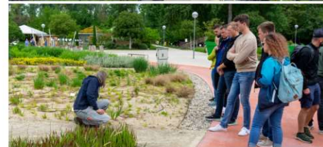
Oben ein Gießwagen im Staudenquartier von Hameter, unten erklärt uns ein Mitarbeiter der Garten Tulln die Pflanzungen.

durch das sehr weitläufige Gelände. Der Betrieb Stauden Hameter ist Mitglied im Staudenring, ein Zusammenschluss mehrerer Staudengärtner im deutschsprachigen Raum. Fachlicher Austausch, aber auch das gegenseitige Versorgen mit Pflanzen und ein günstigerer Einkauf sind die Gründe für eine Mitgliedschaft beim Stauden-