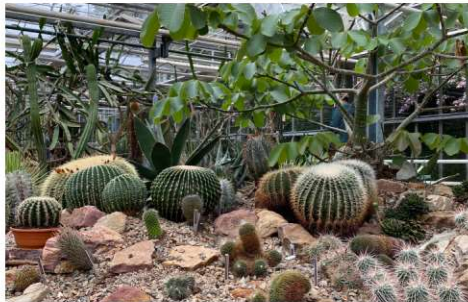
Kakteenhaus im Arboretum Trompenburg, eine parkartig angelegte Baumsammlung in Rotterdam.

seiner Familie. Der sieben Hektar große Garten umfasst eine fantastische Sammlung von Bäumen, Sträuchern, Stauden und Kakteen mitten im Zentrum Rotterdams. In der heute sichtbaren Form wurde der Garten von dem Landschaftsarchitekt Jan David Zocher im Jahr 1870 angelegt. Heute gehört der Garten einer Stiftung. Was besonders bemerkenswert ist, der Garten wird von über 400 freiwillige Helferinnen und Helfer ehrenamtlich gepflegt. Allein daran kann man die Verbundenheit der Holländer zu Ihren Gärten erkennen. Nach der gelungenen Führung hatten die Studie-