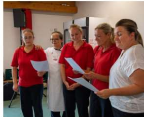
Humorvolles Gstanzl, vorgetragen vom Kücheteam.

aber der Rest war Altbestand, zum Teil 40 bis 60 Jahre alt. Bautechnisch war ich immer zuständig für das Geld und habe die Planung bis zum letzten Pinselstrich begleitet. Bis am Ende nichts mehr geändert werden durfte. Und somit konnte während meiner Zeit einiges saniert und gebaut werden. » ein CA Lager in Deutenkofen » ein Energiepakt (Sanierung des Blockheizkraftwerks, der Fachschule ökologischer Landbau und der Verwaltung) » das Wohnheim 3m mit über 104 Einzelzimmern. Nach einem Entwurf von Professor Dr. Wirsing. » der Neubau der Landmaschinen-