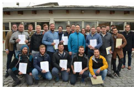
Endlich geschafft, trotz Onlineunterricht und Maskenpflicht. Die W3 2022 hatte es nicht gerade einfach.

nd, zum „Botschafter“ der Fachschule ernannt wurde.