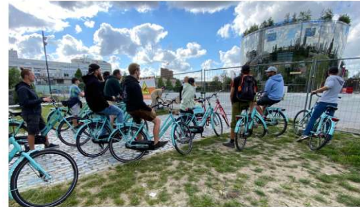
Mit Rad durch die Straßen von Rotterdam, ein Juwel der Stadtarchitektur in Holland.

sorten. Herr Wit – der Ehemalige Geschäftsführer von Esveld, nahm sich die Zeit uns eine Führung an Land und größtenteils auf dem Wasser zu geben. Die Baumschulen in Boskoop sind alle durch ein komplexes und 1.300 Kilometer langes System an Wasserwegen miteinander verbunden. Daher spricht man bei Boskoop auch von dem Venedig Hollands. Aus der Historie hatten alle Baumschulparzellen dieselbe Größe im Raster von ca. 40 x 100m. Wenn einzelne Parzellen zusammengefasst werden, so muss für die zugeschüttete Fläche Wasserausgleichflächen geschaffen