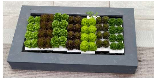
Unten Fische, oben Salat. Das ist ein zukunftsweisendes Konzept der Lebensmittelzeugung in der Stadt.

in den Punkten Gesundheit, Energie, Stadtgrün und Regionalität vor. Während der Holländische Pavillon komplett aus recyceltem Material (Upcycling) mit einem besonders geringen ökologischen Fußabdruck hergestellt wurde, wird am deutschen Stand auf eine besonders interaktive Art und Weise die Vorzüge und die vielen Möglichkeiten von Grün in der Stadt hingewiesen.