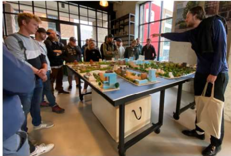
Little cool Haven (littel c), das innovative Neubaugebiet in Rotterdam schafft durch grüne Plätze Aufenthaltsqualität.

Am Donnerstag hatten wir einen kompletten Tag in der Stadt Rotter-